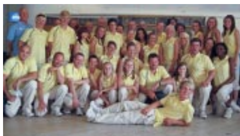
Svenska OS truppen.