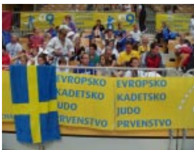
De svenska supportrarna syntes väl i hallen.